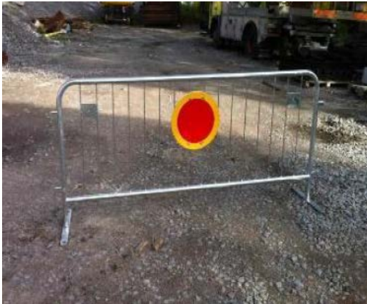
Figur 3: Varningsstängsel med hindermärke

Ärende/Dok. id. 2014-0594 Infosäk. klass K1 (Öppen)